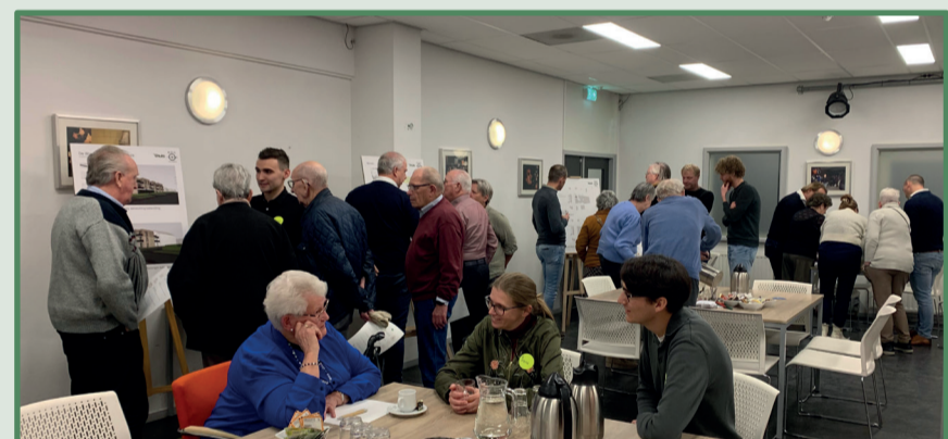
Voorbeeld van hoe een informatiemarkt eruit ziet

JPO wil graag de aangrenzende wijk informeren en betrekken bij de ontwikkelplannen. Tijdens de informatiemarkt zullen we de eerste gedachten voor de nieuwe invulling van voormalige tennisvelden laten zien.